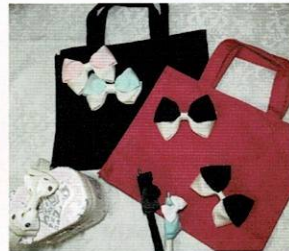
リボンワーク 淵上 知佳(高校51期)