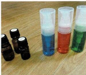
除菌殺菌効果のアロマ配合 カラージェルハンドソープ作り 井上 圭子(高校38期)

1ブース ¥2,000/長机、椅子貸与 出店内容については、お問い合わせ下さい。