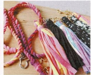
タッセル作り 村川 久子(高校39期)