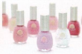
天然成分 爪に優しい水性ネイル 田中 志津(高校39期)